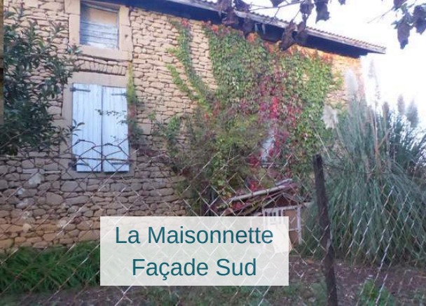
La Maisonnette Façade Sud