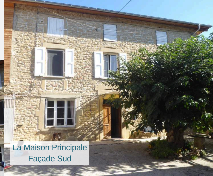
La Maison Principale Façade Sud