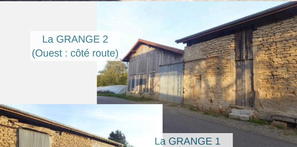
La GRANGE 2 (Ouest : côté route)