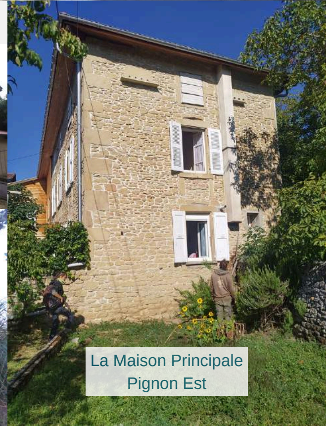
La Maison Principale Pignon Est