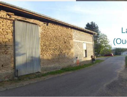
La GRANGE 1 (Ouest : côté route)